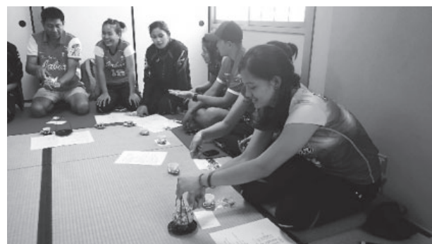
図4 2016年 煎茶部との交流