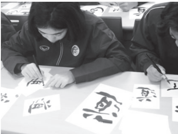
図14 2018年 タイ生徒の書道体験

このスポーツツーリズムに関して、後日、タイの教育大臣より本学こども教育学科宛に感謝状をいただいた。また、この活動は大学新聞(2019)に取り上げられた。つまり、本学のこども教育学科が計画して実践したこの10日間のプログラムが、教育研究活動として社会的に一定の評価を得ることができたといえる。