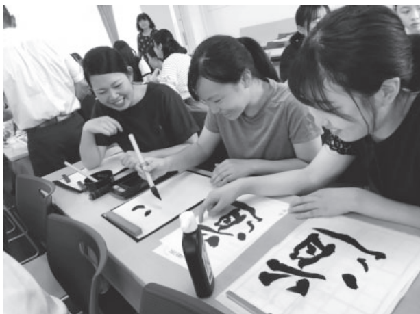
図8 2018年 香港生徒の書道体験