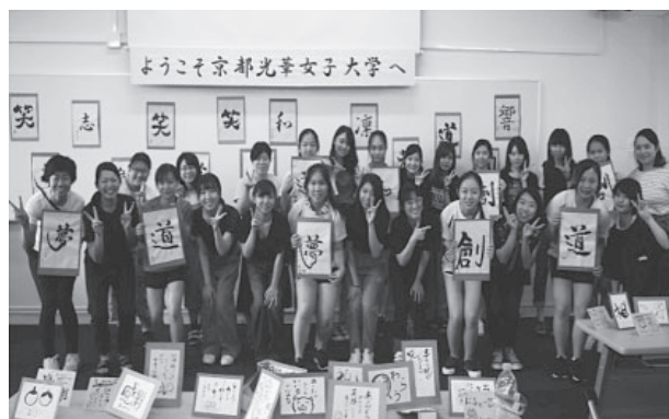
図11 2018年 香港生徒と本学学生