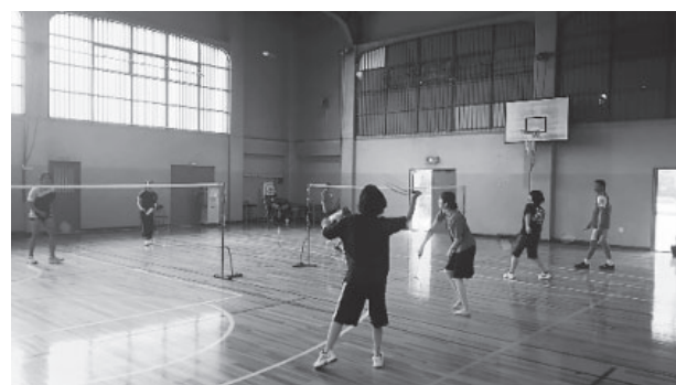
図3 2016年 スポーツ交流