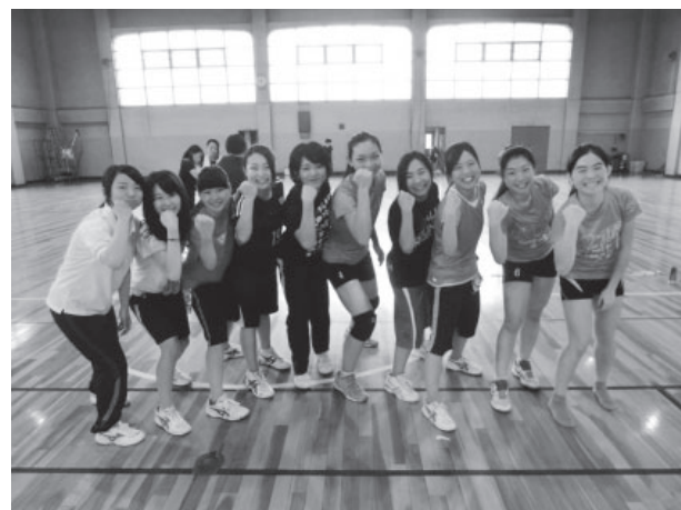
図1 2015年のスポーツ交流 拙稿(2018)より

2019年は、初めてバレーボールの団体ではなく、サッカークラブでなおかつ男子中学生という団体のスポーツツーリズムについて計画と実践を行った。ビジターが男子中学生ということもあり、本学の特色を生かした教育活動の実践には至らなかったが、学生の案内により本学の学食を使用し、光華小学校や他大学に協力いただきサッカーの練習を行うことが実現した。相手を取捨選択するのではなく、どのようなビジターに対してもできる限り期待に応えるべくツーリズムを計画して実践することは、多様性を受け入れる教育につながるととらえ、今後も挑戦していきたい事案であるといえる。