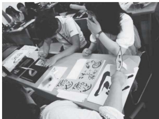
図9 2018年 香港生徒によるメッセージカード作成