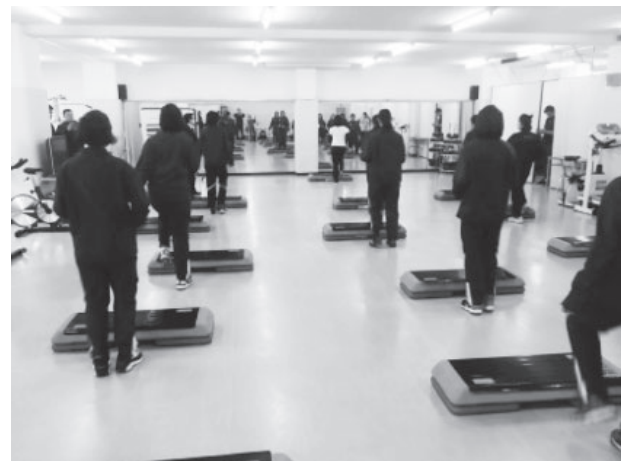
図13 2018年 タイ生徒のエアロビクス体験

また、香港の生徒に好評であった書道と折り紙の体験も、再度プログラムに組み込んだ。書道について今回は、タイの生徒が筆ペンを使用することが初めてであることから、まずは、国語を専門とする教員が筆ペンの持ち方、太い文字、細い文字の書き方を解説し、本学の学生がサポートしながら、お手本の文字を書写