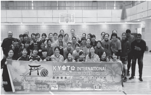
図5 2016年 マレーシアとの交流