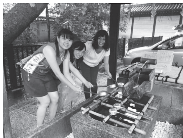
図2 2015年 学生の案内による観光