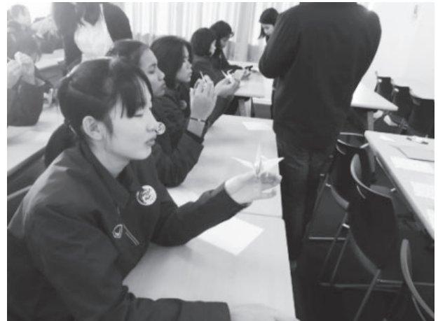
図16 2018年 タイ生徒の折り紙体験