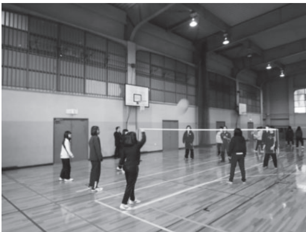
図12 2018年 タイ生徒と本学学生のスポーツ交流