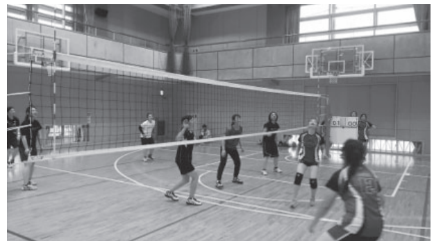
図6 2018年 本学学生と香港生徒のゲーム

折り紙を通じた活動は、折り紙を得意とする本学の3年生有志が2か月前から企画をして、香港生徒の来学を歓迎する活動であった。大学生が実物投影机を使って折り方をゆっくり説明し、サポートする大学生が香港の生徒の隣に座り、鶴と彦星を折り紙で一緒に折った(図10)。活動の最後には、香港の生徒が書いた作品を色紙に貼ってプレゼントし、参加者全員で記念撮影を行い、交流を終了した(図11)。