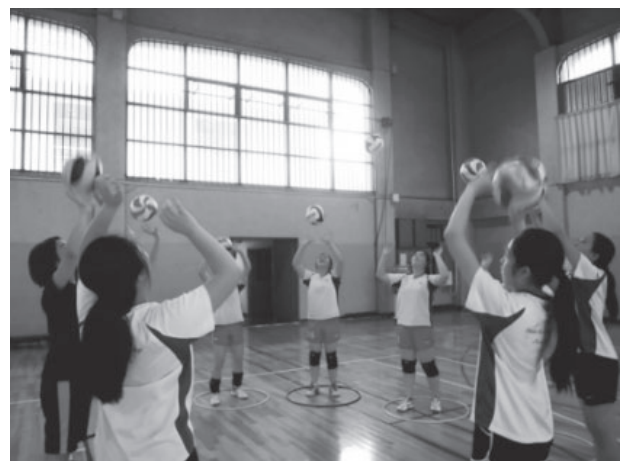
図7 2018年 筆者によるスポーツ指導