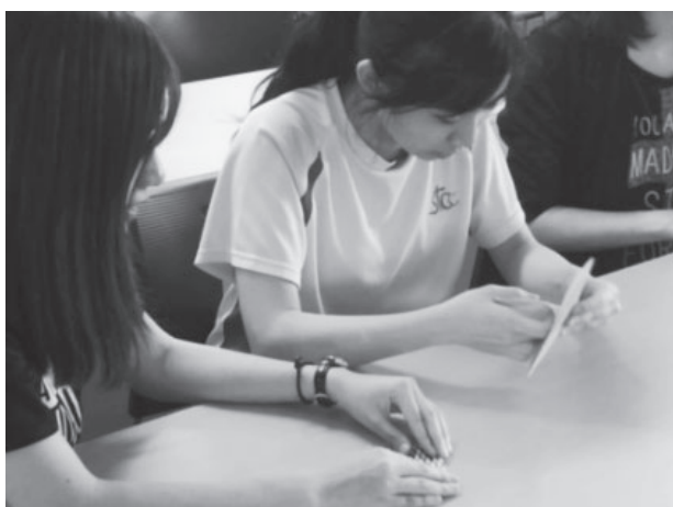
図10 2018年 香港生徒による折り紙体験 (筆者撮影)