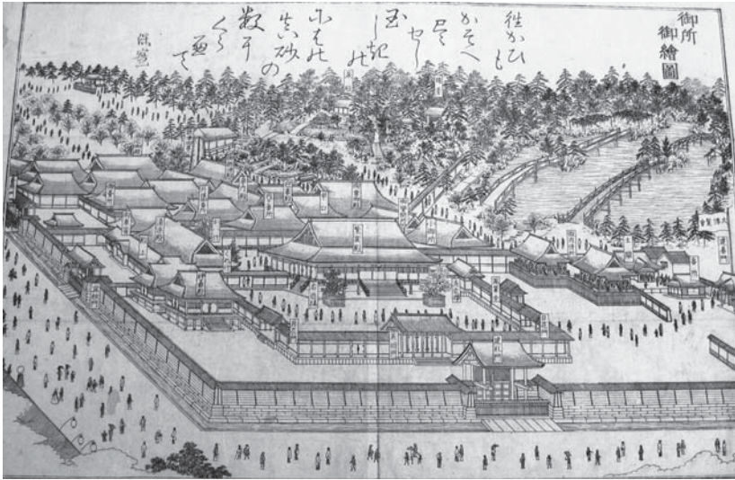
図2 第二回京都博覧会

つまり、ここでは、近代以降の庶民と御所の関係のみについてふれ、博覧会は、庶民にとって御所を訪れる貴重な機会であることが記されていた。少なくとも外国人向けの案内書は、それまで御所が庶民から隔離された場であったように伝えていたことがわかる。また、第一回から第二回博覧会邦人入場者数の大幅な増加を見ると、近代以降の庶民の御所立入禁止がもたらした影響は大きく、人々に御所からの距離感を与えたことがうかがえる。