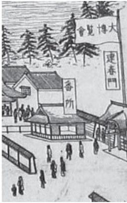
「大博覧会」と書かれた旗がたなびく。 (図2を部分的に拡大)