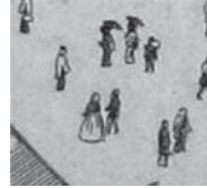
外国人と思われる洋装姿の観覧者が見える。 (図2を部分的に拡大)