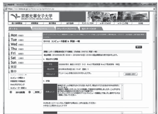
図7 提出レポートへのフィードバック

レポート課題(理解できたこと、理解できなかったこと等を講義ノート形式でまとめて毎回提出する)については、光華naviを利用して、担当教員からのコメントと評価を、できる限りリアルタイムでフィードバックするようにした。(図7)