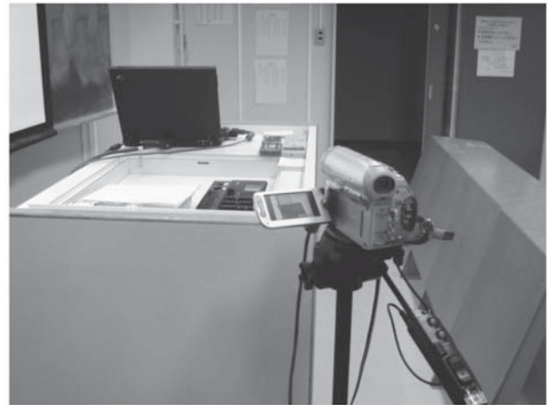
図2 教室での授業収録風景

授業の収録には、MediaDEPOに標準添付されているLive Recorderというクライアントソフトを使用した。これは、授業でプロジェクタに投影するPowerPointを実行するPCに、DVカメラ等の映像撮影機器を接続することにより、授業の進行に合わせリアルタイムで授業ビデオとスライド(PowerPoint)等を同期して自動的にPCのハードディスクに教材コンテンツとして記録することができる(ビデオ映像はWindows Mediaに変換される)。DVカメラを含む機材一式を教室に運び込みセッティングさえしておけば、あとは通常どおり授業進行するだけで、終了時には自動的にコンテンツ作成が完了している。授業終了後、サーバ上ですぐに授業を公開することができる(アップロード作業は、学内ネットワークを経由して手動でおこなう)。(図2)