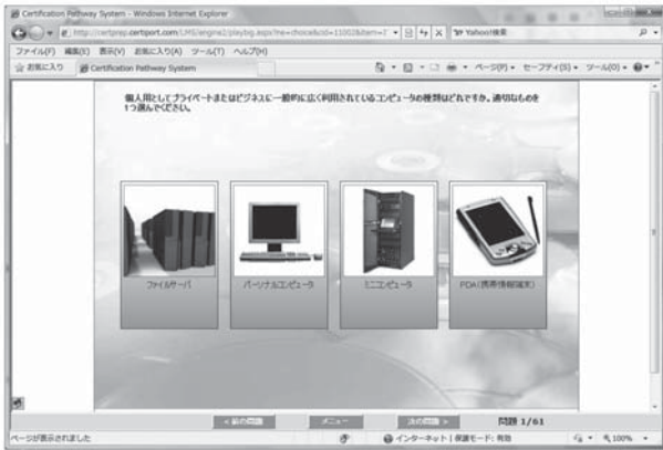
図4 IC3 ベンチマーク

それぞれの合格レベルを到達目標としている。このため毎回の課題教材に、同社が試験対策としてクラウドで提供しているプログラムである「IC3 ベンチマーク」(図4)を利用した。