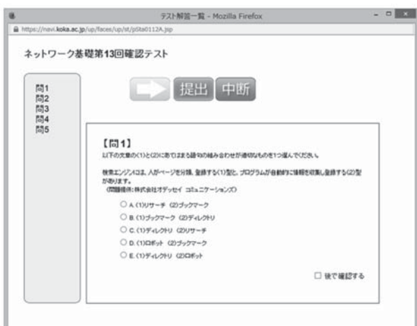
図5 光華navi上に実装した小テスト

2010年度からはIC3ベンチマークに代えて、このeラーニング授業のプラットフォームである「光華navi」上に独自の小テストを実装した。(図5) IC3ベンチマークは有償のサービスであり、受講生の経済的負担を少しでも減らしたかったことと、eラーニングコンテンツ内のアセスメント(テスト等による理解度確認)機能を独自に充実させたかったことによるものであった。