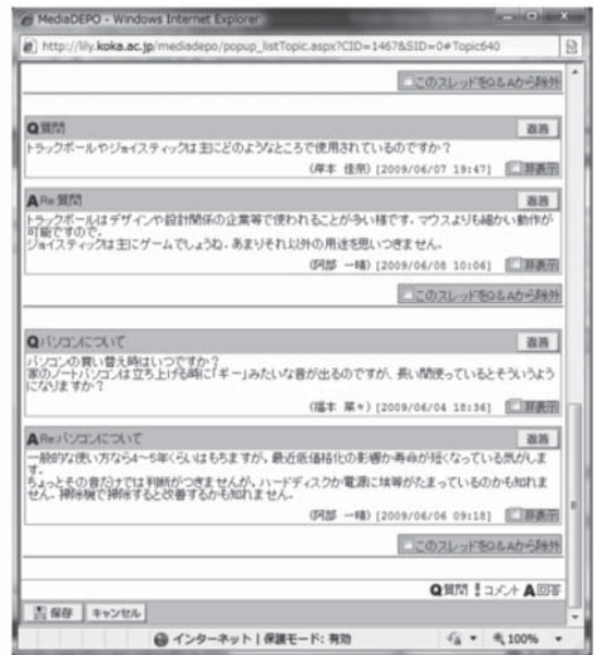
図6 電子掲示板上のQ&A・ディスカッション

に電子掲示板(図6)を利用した。毎回の課題として最低1件の書き込みを義務づけた。