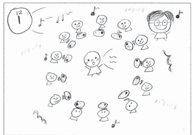
資料3)「それからさあー」のイメージ図

は、保育者が豊かな知識を身につけておく必要があると報告した。子どもがふれるであろう事柄について、保育者は興味を持って学び続け、見識を広げようと向上心を持ち続ける必要があるのである。一方、島の作り方を教えに来てくれたお百姓さんが、虫、鳥、天気のことなども面白く話してくれ、それ以後散歩の際に出会うと「島の先生」と尊敬を込めて呼んだエピソードも読み合うことができた。その道に詳しい人から習うとき、子どもは敬意をもって聞き、更なる興味を向けると報告した。