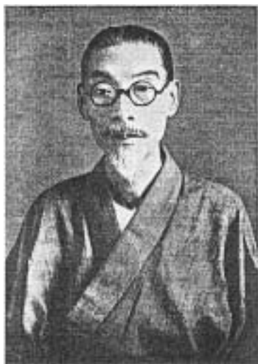
河上 肇 (1879～1946)

特に後半部分の晩年の河上の様子が、いくつかの書簡やエピソードを含めて書き加えられている（P 49－61）。本書の末尾には、加筆訂正の稿了日として、「昭和二十二年十二月二十九日」という記載がある。なお、本書の全文は、のちに、『壽岳文章・しづ著作集』第3巻『よき人を語る』（1970.5、春秋社）に収録されている。