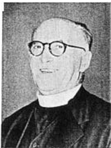
ヨハネス・ラウレス (1891～1959)

ドイツ語で書かれた高山右近伝を刊行し、西洋にすぐれた日本人の存在を訴えること、一方で『聖フランシスコ・ザビエルの生涯』において、かつて日本人とキリスト教とを結びつけた聖人の伝を公刊することは、ともに真摯に相互の友好関係の樹立をめざしていくことにつながる。また、上智大学での「吉利支丹文庫」の整備と、教科書ともいふべき『キリスト教的ヨーロッパ史』の刊行も研究者・教育者としての貢献である。ラウレスは、それぞれに自身の置かれた現実に目を奪われ、自身の打算を行動の動機とするものの多い、戦後の日本にあって、確かに温かい視点に裏付けられた、真摯な貢献を実現している。戦中を日本でしのぎ、戦後の日本を、目立たないながらも、確かに温かいまなざしで見守った、ドイツ人がいたことを