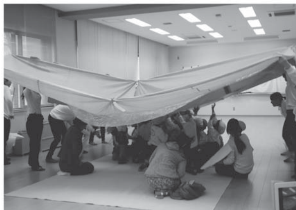
資料7. 絵本『なみ』作品発表の様子

以上、各グループの創作と発表に至る過程をあげた。12回目以降は、グループ活動を行いながら、全体授業も下記のように進めた。