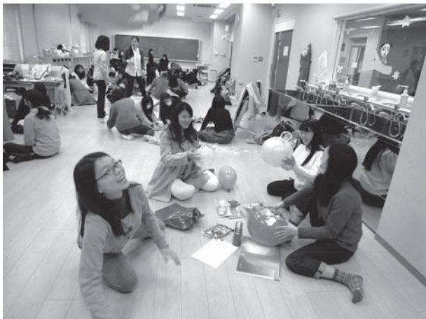
資料6. 絵本『もこもこもこ』作品制作の様子

やおもちゃ・楽器（グロッケン、クラッカー等）に加えてボディソックスを選択しつつ工夫を積み重ねて創作を試みた。「触れる・感じる・さぐる」などいろいろな味わうスタイルを工夫し、「ことば」・「からだ」・「音」・「響き（声）」の世界のコラボレーションを楽しみ味わう作品を以下のような過程を経て創り上げた。