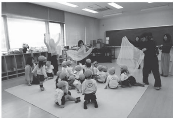
資料 1. 素材の性質を表現する活動の様子

課題としては、完成のイメージを持ちにくかったという学生の感想に見られたが、作例を示したり子どもの事例を示すなどしてイメージを持たせることも一つのやり方ではあるが、より自由な表現活動、作品の制作には、何もない状態から始めることがそれぞれのイメージや思いを表現することにつながるかもしれない。また学生の動きを引き出すための擬態語などの声かけが必要であり、言葉と共に指導者自身も動くことが豊かな表現活動を引き出すことに繋がると考えられた。