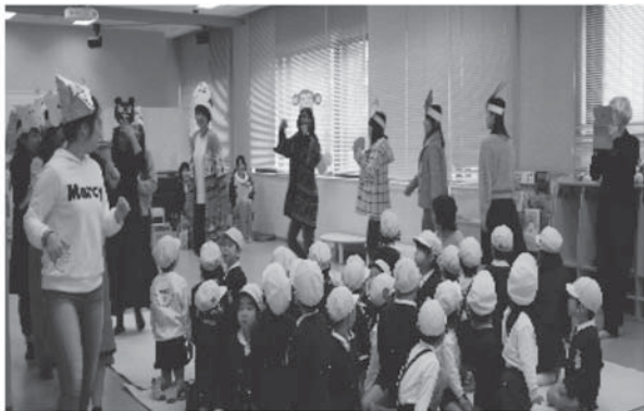
資料 2. 4 歳児を対象にした作品発表の様子

合表現Ⅲ」を計画、実践していく予定である。そこで「総合表現Ⅲ」のパイロット実践として行った平成 27 年度後期短期大学部こども保育学科 2 年次「保育実践演習」での取り組みを次項に挙げることにする。