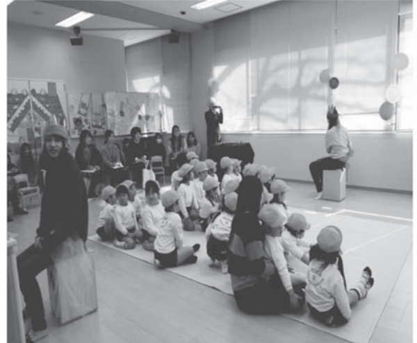
資料5. 「しあわせをよぶおんがくたい」作品発表の様子

ピアノ曲〈土人のおどり〉（中田喜直作曲）と〈道化師〉（カバレフスキー作曲）から得たイメージを、楽器（カホン・ピアノ・フルート・ビブラスラップ・ロリポップ等）や身体、小道具（ピエロの鼻、サンタクロースの衣装、バルーンアート等）を使って表現す