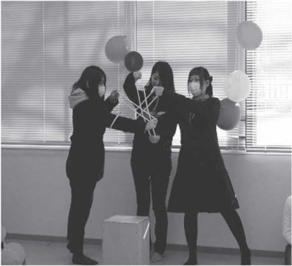
資料4. 絵本『ぱびゅべぼ』作品発表の様子

どって、リボンを用いて身体の動きで表すなど、3人一組で絵本の5場面それぞれのページを譜面に見立てて読み、表現として立ち上げた。動き（模倣・ミラー）、音（響きのリレー）、声（声のリレー・高低・大小・長短）などを経験しながら、以下のような段階を経て五七五の語調を生かした作品を作り上げた。